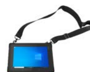
ショルダーストラップ